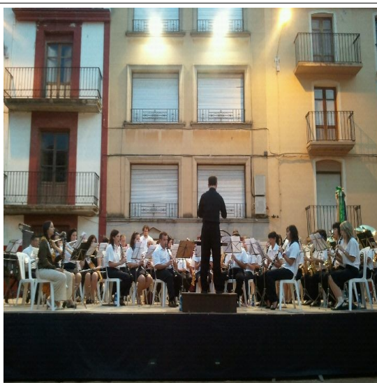
Foto de la banda de Benassal interpretando TABÚ, obra obligada en el certamen de la Comunitat Valenciana.